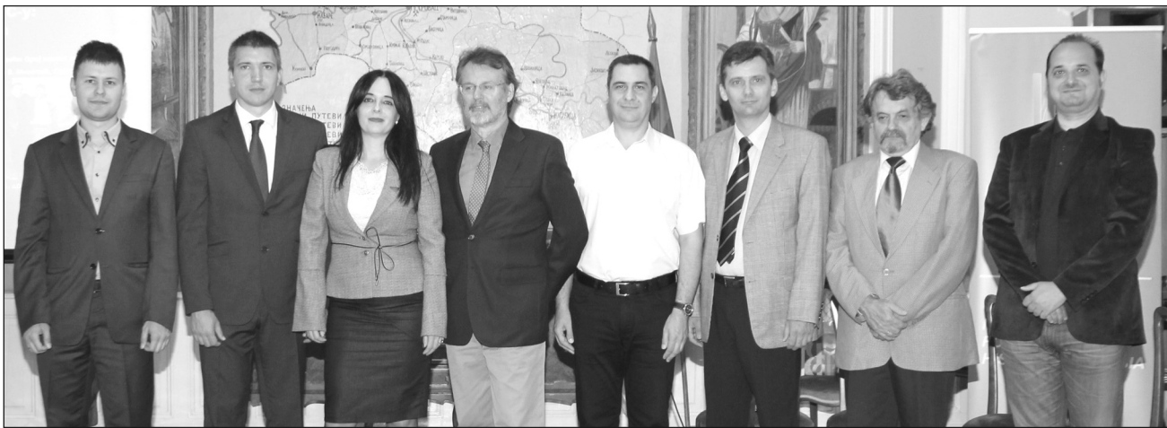
Запослени ИНИС-а на свечаности у Пожаревцу

У претходном вишегодишњем периоду Архив је иницирао, покренуо и реализовао на десетине истраживачких пројеката чији су крајњи резултати 80 публикованих архивских издања кроз 7 архивских едиција, 30 архивских изложби, 30 виртуелних изложби, три међународна научна скупа и Међународни часопис „Записи“,