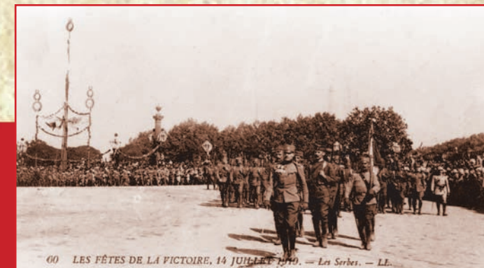
Париз, 14. јул 1919. Дефиле српске војске на Паради победе