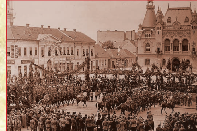
Србија, 1918. Свечаности у ослобођеним градовима Србије