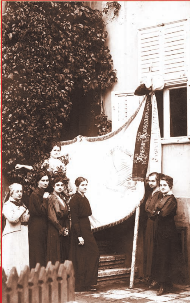
Пожаревац, (16) 29. октобар 1918. Везиље – чланице Кола српских сестара из Пожареваца поред заставе коју су израдиле и предале ослободиоцима Пожареваца 1918.