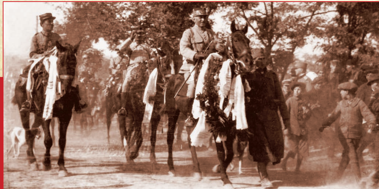
Пожаревац, 16 (29) октобар 1918. Француске трупе улазе у слобођени Пожаревац