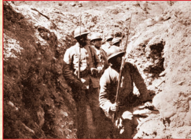
Септембар, 1915. Српска пешадија креће у пробој