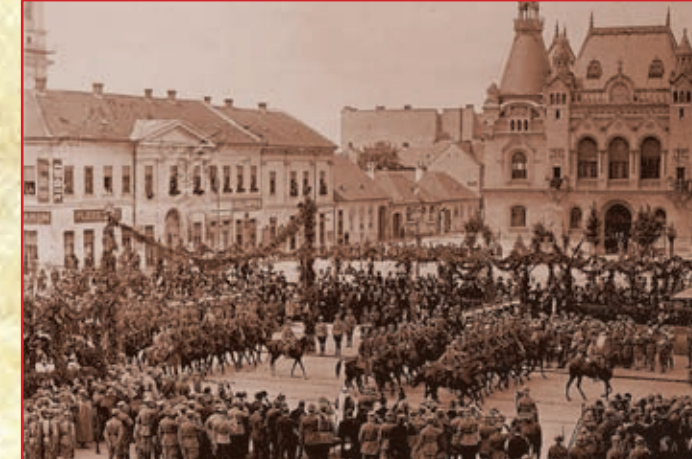
Србија, 1918. Ослобођење српских градова: Суботица

Ostrovo, le 1 er août 1915. La Section de ferrure à Ostrovo