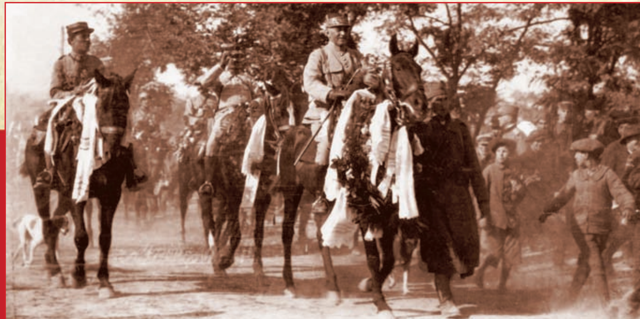
Пожаревац, 16 (29) октобар 1918. Француске трупе улазе у ослобођени Пожаревац