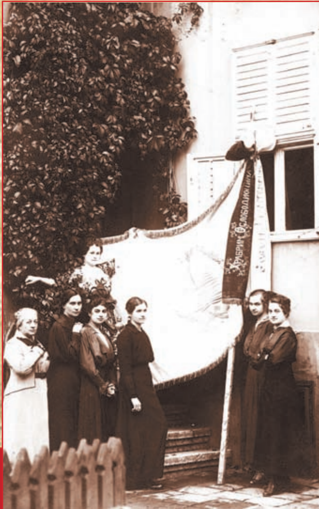
Пожаревац, 28. октобар 1918. Везиле – чланице Кола српских сестара из Пожареваца, поред заставе коју су саме израдиле и предале ослободиоцима Пожареваца 16. (28) октобра 1918. године