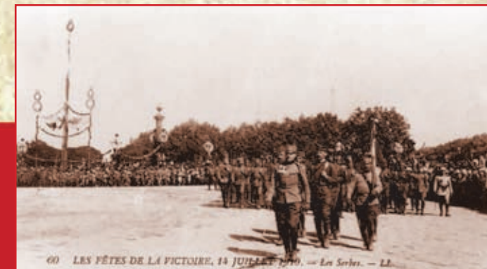
Париз, 14. јул 1919. Дефиле српске војске на Паради победе

Požarevac, le 28 octobre 1918 Les troupes françaises entrent à Pozarevac libéré