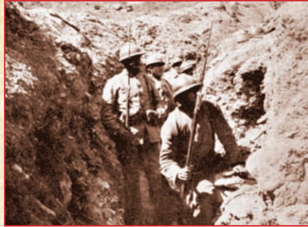
Септембар, 1915. Српска пешадија креће у пробој