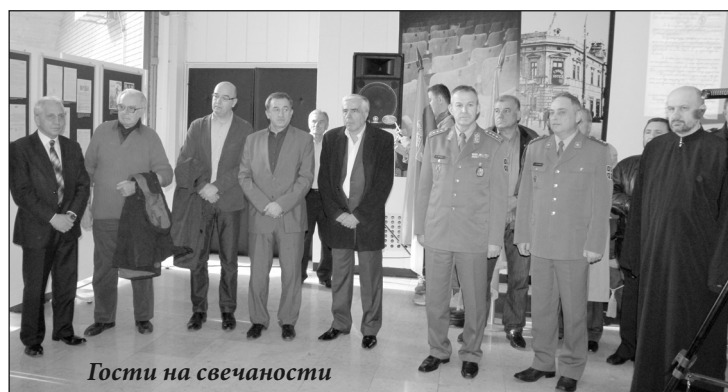
Гости на свечаности

Посебна вредност пројекта је његова експлицитност при тумачењу и представљању ориги-